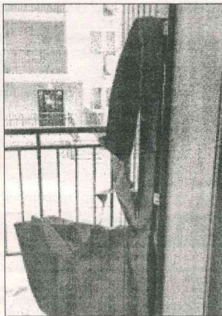
Так выглядят двери на ул. Янгеля после «забав» вандалов...

двери, так как вандалы выломали еще несколько дверей. Надо сказать, что замена дверей, особенно в общежитиях и новостройках – это большая статья расходов наших управляющих компаний и ответственных плательщиков. А потому обращаемся к жителям всех домов, а особенно – общежитий, с просьбой бережно относиться к общедомовому имуществу, не допускать его порчи и поломок.