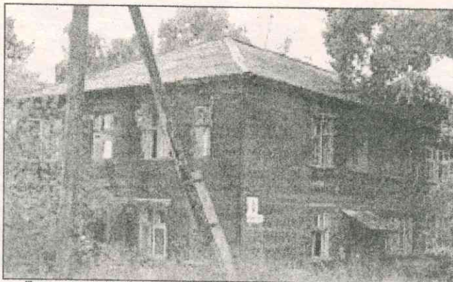
Дом на ул. Набережной, 9.

Тариф «ЖЭК-Энергия» на обслуживание одноподъездного деревянного 8-квартирного дома на ул. 25-летия Партсъезда, 5 составляет 34 рубля 58 копеек за квадратный метр. Насколько нам известно, в Братске нет ни одного, даже элитного, с таким тарифом! Но и это еще не все. Тариф управляющей компании для дома на ул. Набережной, 9, внимание! - предназначенного под снос (теоретически, его должны были снести уже этим летом), составляет 42 рубля 61 копейку за